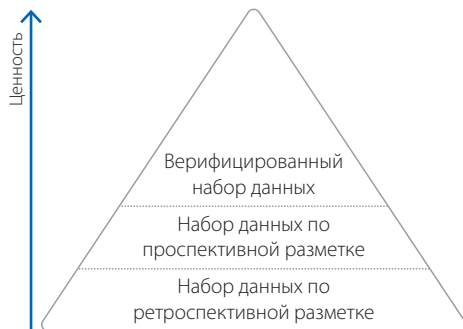
Рисунок 4 – Классификация видов разметки по степени ценности