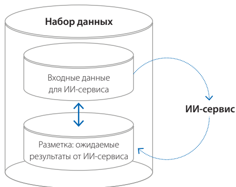
Рисунок 2 – Единица набора данных (в наборе данных присутствуют парные, однозначно соответствующие друг другу записи входных данных и разметки)

Под единицей набора данных понимается парная запись входных данных для систем ИИ и ожидаемые выходные данные от системы ИИ, после обработки и анализа входных данных (рисунок 2). Ожидаемые выходные данные формируются в процессе разметки, т.е. процесс разметки позволяет создать эталонные, «правильные» ответы, по которым затем будут оцениваться ответы от системы ИИ в целях их разработки, тестирования и/или пострегистрационного мониторинга.