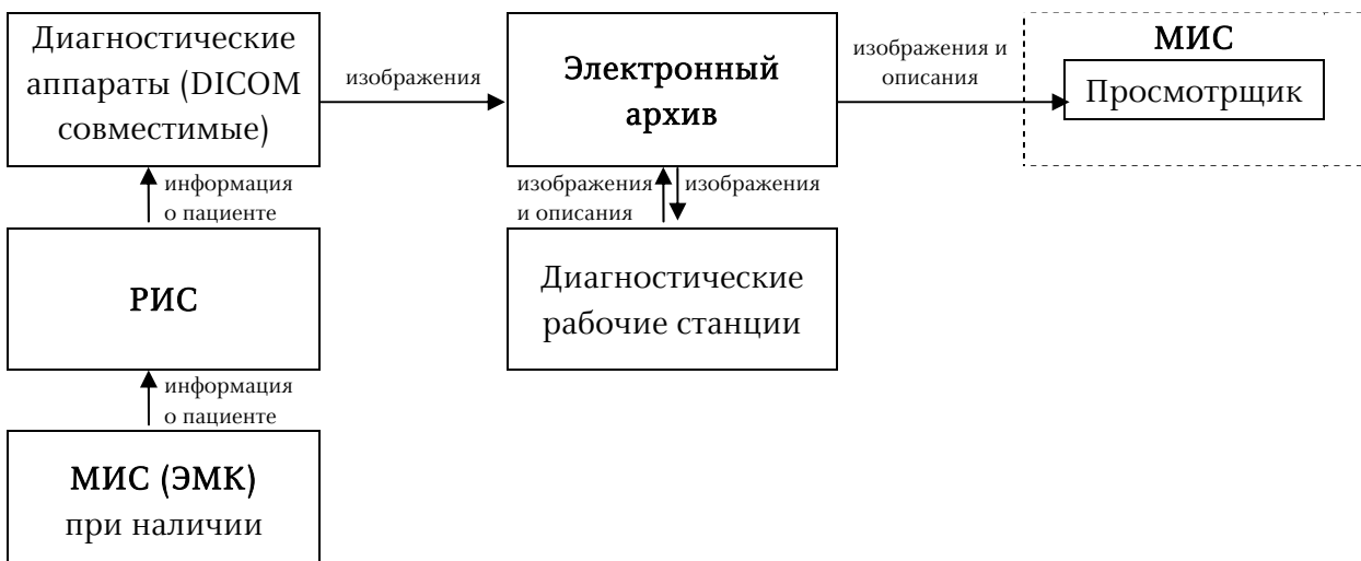
Схема 1 - Базовый уровень